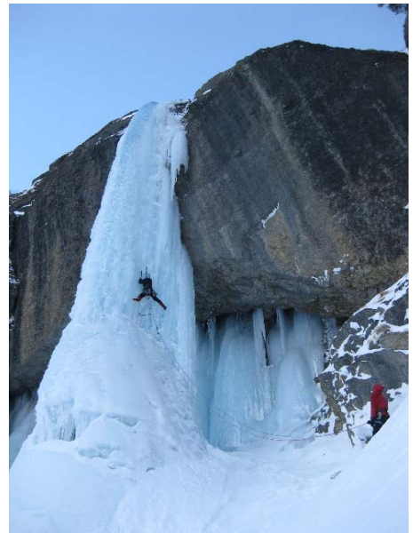
Rémi, le « géant » des tempêtes (L2)

Les 2 premières cordées se retrouvent au pied des voies vers 17h30. Il n'y a plus de matériel au pied du Clan la cagoule , ils ont déjà dû descendre. Encore 2h30 pour rentrer au parking de nuit. La galère... d'autant que Morgan & Florian ne sont pas là ! On les attend au gîte où ils arrivent vers minuit (on rassure le PGHM déjà alerté...) : ils ont fini tard dans la voie, ont beaucoup brassé en voulant rejoindre la descente du Monde des glaces , avant de descendre sur lunules et de nuit dans leur voie. Une grosse bambée pour entamer ce 1 er rassemblement ☺