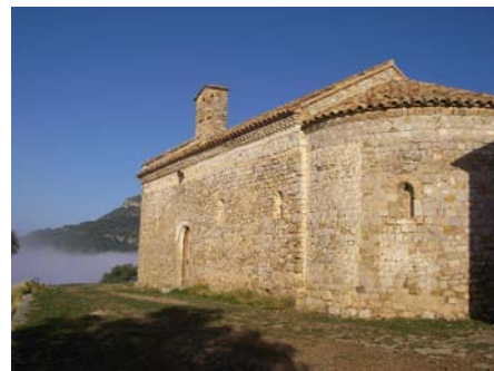
Ermitage de Vilanova de Meià

Après les rassemblements à la Pedraforca et à l'Ossau, les équipes FFME Pyrénées et FFCAM Midi-Pyrénées sont à nouveau réunies ; les membres commencent à bien se connaître.