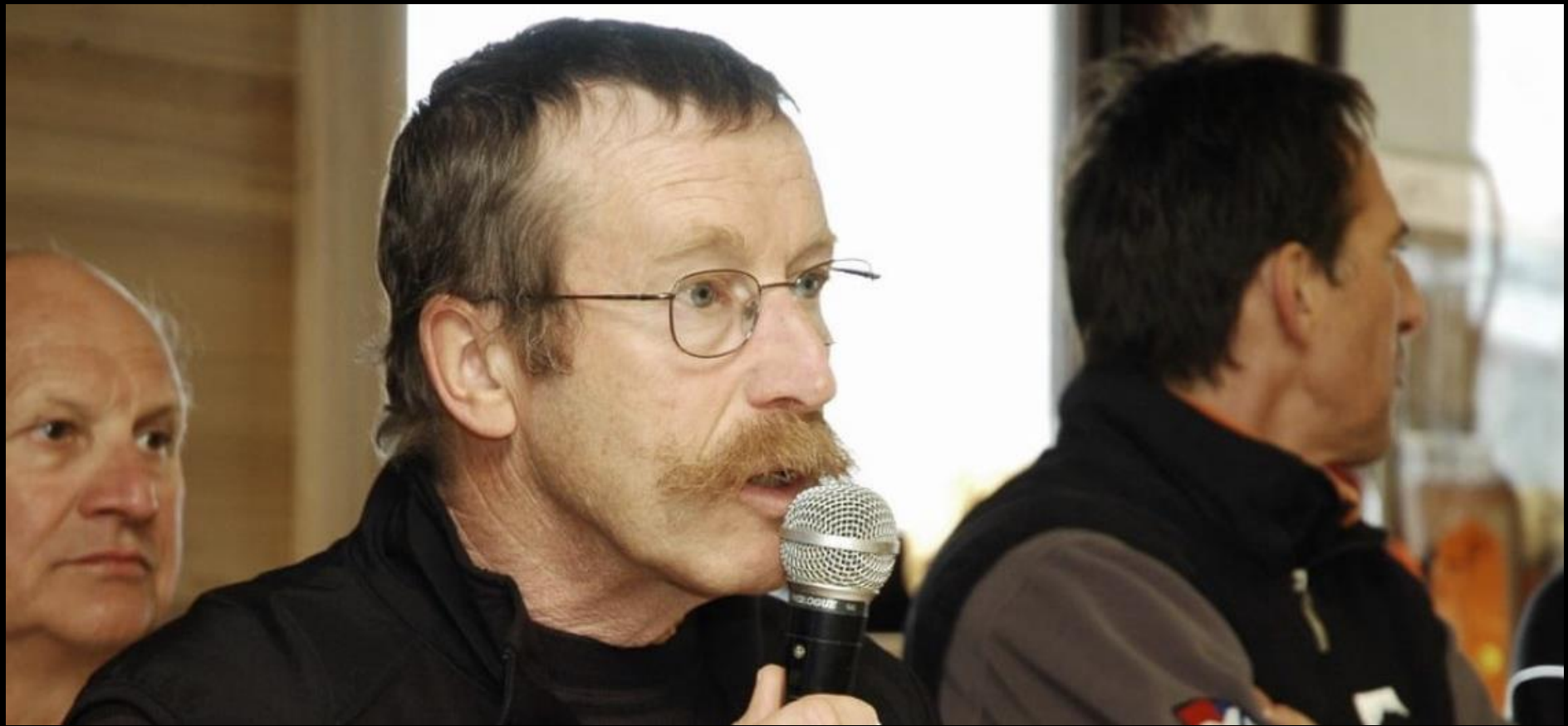
In Memoriam – Pierre Dollo